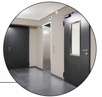
STÅL- OG BRANDDØRE